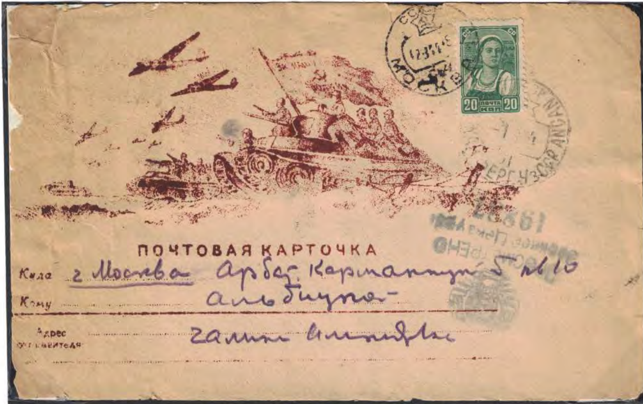
Почтовая карточка из г. Коканд Ферганской обл. Узбекистана (31.08.1944) в г. Москва (12.09.1944). Просмотрено военной цензурой 19827.